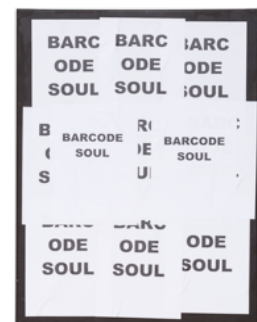
HYPER-POEM PAINTING (BARCODESOUL)

Graphite, paper, glue and acrylic on canvas